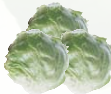
EXPORTACIÓN ACUMULADA DE LECHUGAS SEGÚN MERCADO DE DESTINO (PERÍODO 2002-2007)